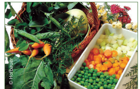
Gemüse vor dem Einfrieren blanchieren

Was ist beim Einfrieren zu beachten? Nur frische Ernte und beste Qualität verwenden. Das Gemüse waschen, evtl. zerkleinern und blanchieren. Dabei wird das Gemüse kurz in kochendes Wasser gegeben und sofort kalt abgeschreckt. Dann abtropfen lassen und sofort luftdicht verpackt in Gefrierbehältern einfrieren.