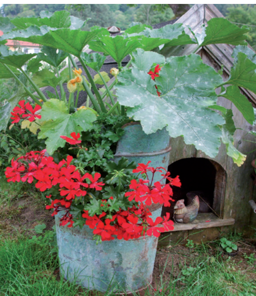
Alte Fässer müssen nicht entsorgt werden, sondern können als Pflanzgefäß für Kürbis und Balkonblumen dienen.

Alte Emailleschüsseln und Blechwannen sind nicht nur ein Blickfang im Garten, sie bringen auch reiche Ernte. Bevor die alten Utensilien auf dem Müll landen, sollte man prüfen, ob sie neuen Zwecken zugeführt werden können.