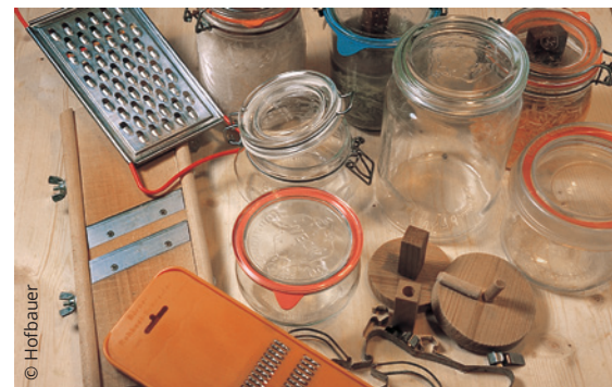
Gemüsehobel, -raspel, Einmachgläser und Stampfer zum Verdichten sind wichtige Hilfsmittel fürs Fermentieren.

Altes Wissen ist wieder gefragt. Den Speiseplan mit fermentiertem Gemüse zu bereichern, liegt im Trend. Besonders bei jungen Leuten im städtischen Bereich findet das Fermentieren immer mehr Zuspruch. Die überlieferte Methode weckt Neugier und Experimentierfreude. Es lohnt sich, verschiedene Gemüse auszuprobieren, denn dieses Hobby erfordert keine große Investition, es können kleine Mengen produziert werden und gleichzeitig ist es ein Ansporn für eine bewusste, gesunde Ernährung.