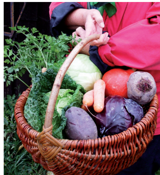
Aus dem eigenen Garten kann man eine große Fülle saisonaler Gemüsearten verwerten und somit einen Beitrag zur Nachhaltigkeit leisten.

Kurze Transportwege, v. a. beim Gemüseanbau im eigenen Garten, verbessern die Ökobilanz im Gegensatz zu Importware aus fernen Ländern – nehmen wir als Beispiel nur einmal Avocados aus Südamerika: Diese Frucht wird in Großplantagen als Monokultur angebaut und hat einen sehr hohen Wasserverbrauch. Wasser ist dort sehr knapp, es wird von den Großplantagen den benachbarten Kleinbauern entzogen und dadurch deren Existenzgrundlage vernichtet. Unser Verbraucherverhalten und unsere Essgewohnheiten haben also eine weltweite Auswirkung!