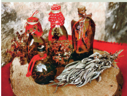
Kräuteröl lässt sich in großer Vielfalt leicht selber herstellen...

Alles in eine große Flasche füllen. Der Flascheninhalt wird täglich einmal geschüttelt. Nach 4 Wochen können die Kräuter und Gewürze entfernt werden. Das Kräuteröl eignet sich zum Würzen von Fleisch, Salaten oder Bratkartoffeln.