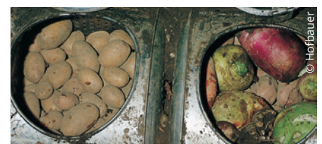
Knollen- und Wurzelgemüse kann man sowohl in Sand einlegen als auch in Erdtrommeln lagern.

Früher gab es mehr geeignete Keller, um Gemüse und Obst zu lagern. Die optimale Raumtemperatur eines Kellers sollte 8 °C betragen und die Luftfeuchtigkeit 80 %. In den wenigsten Häusern gibt es diese Voraussetzungen. Die Keller sind meist zu trocken und zu warm, weswegen das