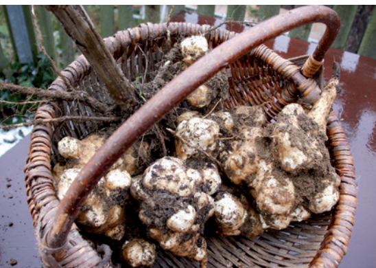
Reiche Ernte an wertvollen Topinamburknollen

Auch auf Bauernmärkten und im regionalen Handel gibt es dieses Saison Gemüse zu günstigen Preisen, z. B. Rote Bete, Sellerie, Möhren oder Pastinaken. Einiges kann direkt frisch den ganzen Winter über geerntet werden, z. B. Topinambur und Schwarzwurzeln.