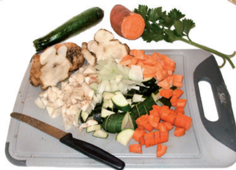
Buntgemischte Zutaten für einen Topinambur-Gemüseintopf

Bei Bedarf wenig Wasser dazugeben, mit Kräutersalz oder Gemüsebrühe-Würze abschmecken, ca. 8–10 Minuten garen und mit verschiedenen frischen Kräutern servieren.