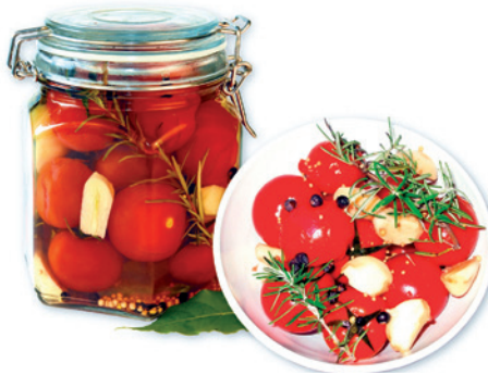
Marinierte Cocktailtomaten – nicht nur ein geschmacklicher, sondern auch ein optischer Genuss

Marinade-Cocktailtomaten halten sich mindestens vier Wochen, wenn sie kühl und dunkel stehen.