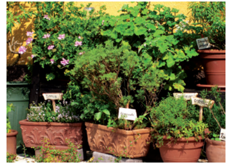
Für die Konservierungsmethode des Trocknens sind besonders Kräuter geeignet.

Das Trocknen ist die älteste Konservierungsmethode, sie wird hauptsächlich bei Kräutern, weniger bei Gemüse angewendet. Die Kräuter sollten vor dem Trocknen nicht gewaschen werden, sonst kann sich Schimmel bilden. Da Pflanzen zu 70 bis 90 % aus Wasser bestehen, beeinflusst der Trockenprozess die Qualität der getrockneten Kräuter erheblich.