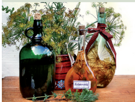
...ebenso wie Kräuteressig, bei dem es beinahe unendliche Variationsmöglichkeiten gibt.

Frische Kräuter waschen, Stiele entfernen. Zwiebeln und Knoblauch schälen, grob zerkleinern. Alles zusammen in große Flaschen oder Ballone geben. Vier Wochen durchziehen lassen, abseihen und in Flaschen füllen.