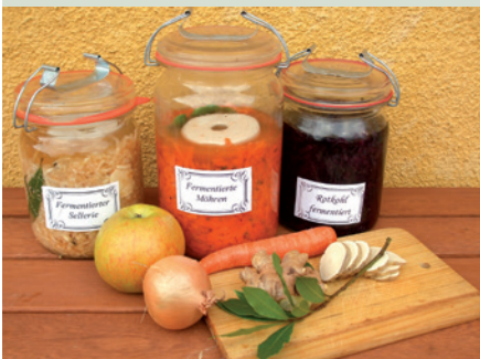
Sellerie, Möhren und Rotkohl lassen sich gut fermentieren und ergeben gesunde und farblich ansprechende Produkte.

Beschwerstein oder ein kleines Glas mit Wasser daraufsetzen. Deckel auflegen und ca. 8 Tage bei Zimmertemperatur fermentieren lassen, täglich kontrollieren. Wenn das Gemüse leicht säuerlich schmeckt, ist es fertig. Anschließend das Glas fest verschließen und in den Kühlschrank stellen.