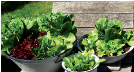
Mit Gemüse bepflanzte Emailleschüsseln und -töpfe lassen sich auf Schubkarren als „mobile Hochbeete“ einsetzen.

Großmutter's alte Teigschüsseln, wie man sie früher in jedem Haushalt vorfand, eignen sich besonders für den Salatbau. Die Salatköpfe wachsen hier wie die „Schwammerl“ und sind vor Schneckenfraß geschützt.