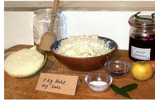
Wichtig für das Fermentieren ist gesundes, sauberes, zerkleinertes Gemüse als Ausgangsmaterial.

Es ist spannend, zu experimentieren und sich an verschiedenem Gemüse heranzuwagen – viel Erfolg.