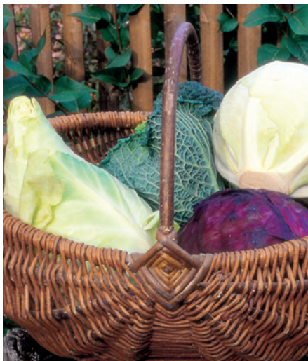
Verschiedene Kohllarten eignen sich besonders zum Fermentieren.

Fermentierte Kost hat besonders für unsere Darmflora gesundheitliche Vorteile. Sie ist „lebendige Nahrung“ und hat einen günstigen Einfluss auf das Immunsystem. Die vorhandenen Milchsäurebakterien wandeln die im Gemüse enthaltenen Zuckerarten in Milchsäure um. Die Milchsäurevergärung hat den Vorteil, dass die Vitamine weitgehend erhalten bleiben, außerdem wird Lactose zu Milchsäure abgebaut. Das Gemüse wird bekömmlicher, schmeckt gut und ist die ideale Salatbeilage, zumal es nach der Vergärung fix und fertig ist und jederzeit zur Verfügung steht. Portionsweise in kleine Gläser abgefüllt kann es auch zum Arbeitsplatz mitgenommen werden.