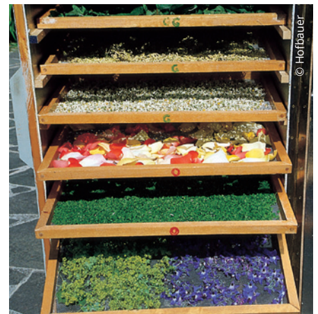
Kräuter – und auch Blüten – kann man auf mit Stoff bespannten Holzrahmen trocknen.

Die Kräuter in kleinen Büscheln an die Leine hängen und sofort abnehmen, wenn sie trocken sind. Gut bewahrt hat sich, wenn dicke Stängel (z. B. bei Minze und Melisse) gleich nach der Ernte entfernt werden und die Kräuterblätter locker auf einen mit luftdurchlässigem Stoff bespannten Holzrahmen ausgebreitet werden.