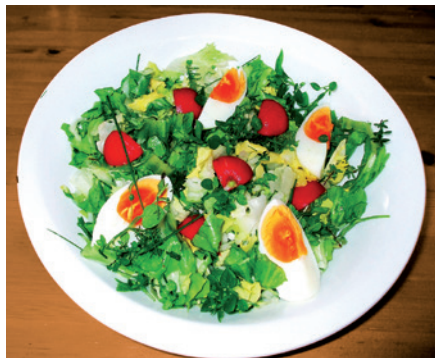
Saisonale Freilandsalate sind sowohl für die Gesundheit als auch für das Auge eine Wohltat.

Zu bevorzugen ist eigene oder regional angebotene saisonale Frischware, möglichst aus ökologischem Anbau. Kopfsalat ist im Sommer weit weniger mit Nitrat belastet als im Winter. Tiefkühlgemüse ist nitratärmer als Treibhausgemüse, weil es im Sommer gewachsen ist und sofort eingefroren wird.