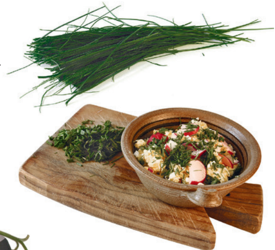
Wilden Schnittlauch (oben, Winterernte) und Schnittlauch aus dem Garten kann man für deftige Eiaufstriche verwenden.

cken an geschützten Stellen. Bei genauer Naturbeobachtung kann man ihn schon ab Dezember entdecken und ernten. Er entwickelt bis April seine Röhren, und dann zieht er sich allmählich zurück und zeigt sich erst wieder, wenn es kalt wird. Die Natur hat es weise eingerichtet, denn während der Vegetationszeit gibt es den kultivierten Gartenschnittlauch.